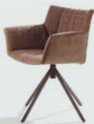
LABEL Gustav jr.

Een van de aller sterkste leersoorten komt van de Yak, die leeft in het ruige klimaat van de Himalaya. Het is een leer vol leven, dat nagenoeg onverslijtbaar is en met de jaren alleen maar mooier wordt. Yak-leer geeft de meubels van Label zowel een uniek karakter als een unieke levensduur.