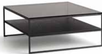
BEEK COLLECTION Cubic T