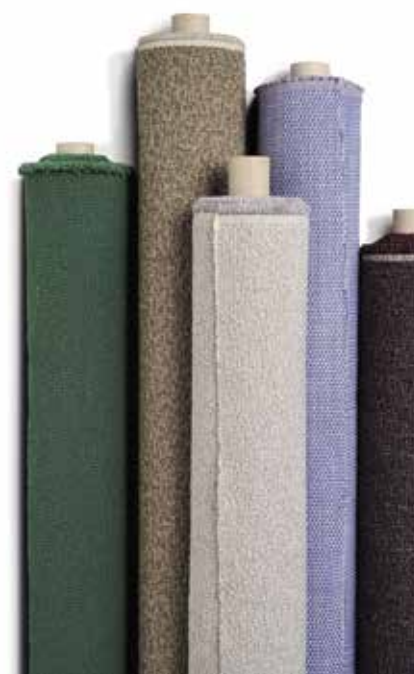
DE PLOEG Twinwool

Een mooi voorbeeld is hun innovatieve meubelstof Twinwool, die bestaat uit wol verweven met garen dat is gewonnen uit oceaanplastic. Dat is niet alleen goed voor de aarde, maar geeft ook een aantrekkelijk tweekleurig effect aan deze sterke stof.