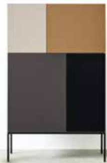
PASTOE Vision Cabinet