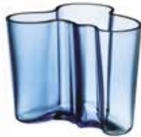
IITTALA Aalto vaas