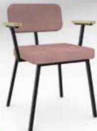
STUDIO HENK Ode