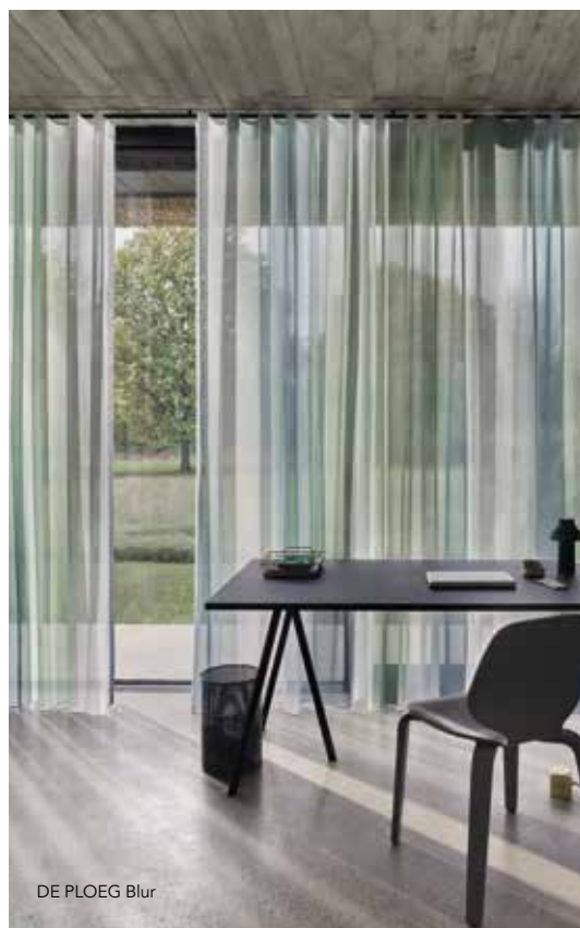
DE PLOEG Blur