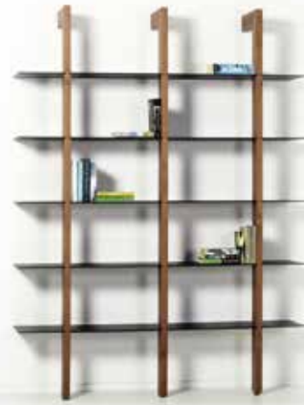
CASTELIJN Groove XS