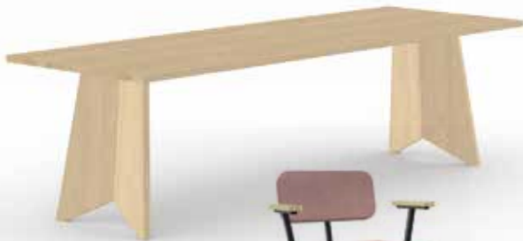
STUDIO HENK Butterfly Wood